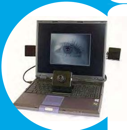
EyeTech Digital Sys