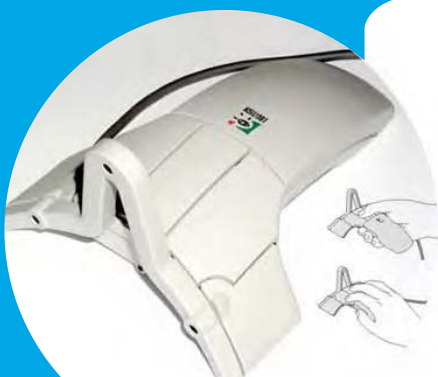
Logitech 3D Mouse