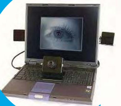
EyeTech Digital Sys